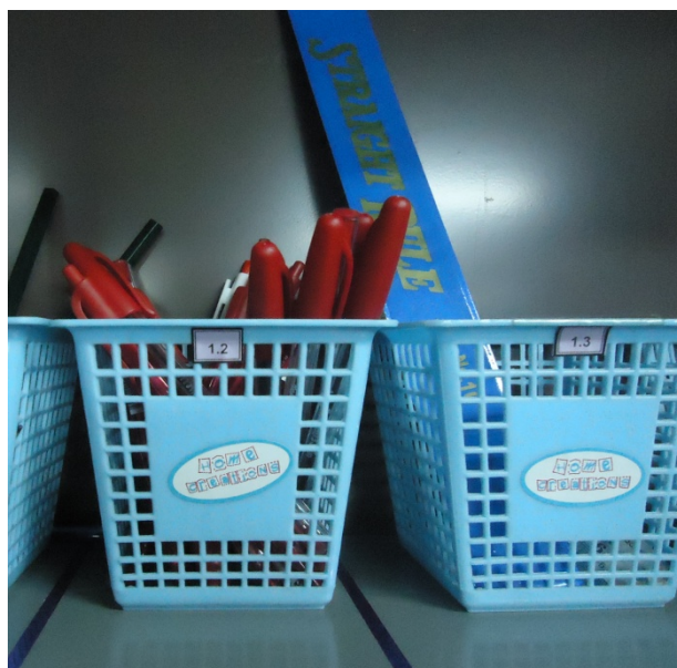
ภาพประกอบที่ 3 ตำแหน่งที่วางพร้อมหมายเลขกำกับ

2. ตีเส้นขอบเขตตำแหน่งที่วางและกำหนดหมายเลขของวัสดุอุปกรณ์แต่ละรายการ พร้อมทั้งติดหมายกำกับ ดังภาพประกอบที่ 3